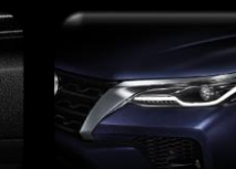
Luces Bi- LED