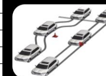
Frenos ABS con distribución electrónica de frenado (EBD)+ Asistente de Frenado (BA)