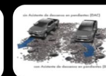
Sistema de arranque en Descenso (DAC)