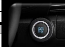
Botón de arranque