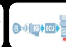
Inmovilizador de motor