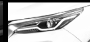
Súper Blanco II