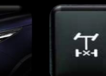
Bloqueador Dif. trasero