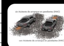
Sistema de arranque en pendientes (HAC)