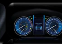
Pantalla TFT 4.2" multi-información