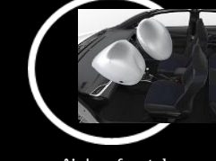
Air bag frontales