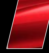
Rojo Mica Metálico (3R3)