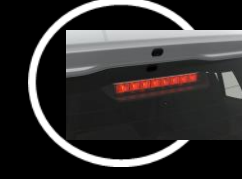
Tercera luz de freno