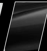
Negro Mica (218)