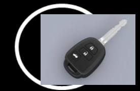
Llave de encendido