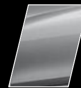
Plateado Metálico (1D4)