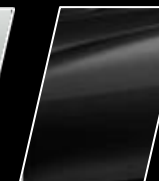
Negro Actitud (218)