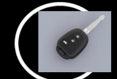
Llave de encendido Versión STD