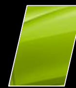
Verde Metálico (6W2)