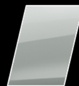
Súper Blanco II (040)