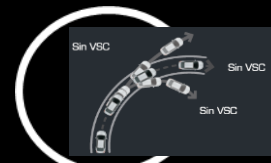
Control de estabilidad VSC