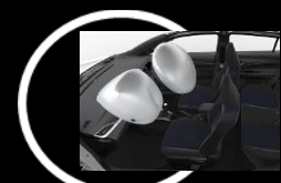
Air bag frontales