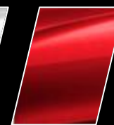
Rojo Mica Metálico (3R3)