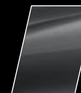
Gris Metálico (1G3)