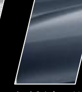
Azul Grisáceo Metálico (8R3)