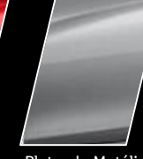
Plateado Metálico (1D4)