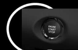
Encendido con botón Versión HG