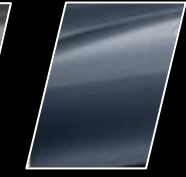
Azul Grisáceo Metálico (8R3)