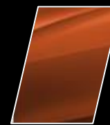
Anaranjado Metálico (4R8)