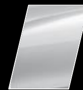
Blanco Perlado Platino (089)