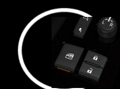
Vidrios y seguros eléctricos