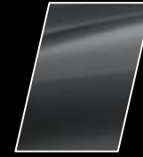
Gris Metálico (1G3)