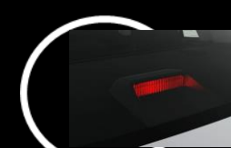
Tercera luz de freno