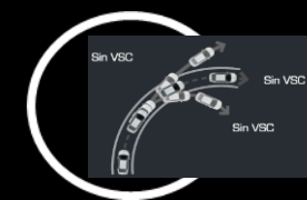
Control de estabilidad VSC