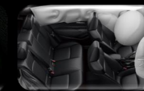
7 bolsas de aire