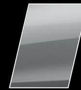
Plata Metalizado (1H6)