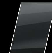
Gris Metálico (1G3)