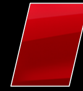
Rojo Mica Metálico (3R3)