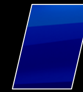
Azul Nébula Metálico (8X2)