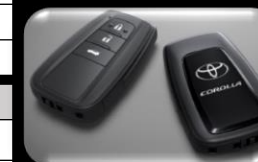
Control de entrada inteligente