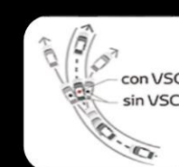
Control de estabilidad del vehículo VSC