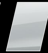
Super Blanco II (040)