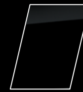
Negro Actitud (215)