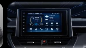
Sistema de Info-Entretenimiento de 9"