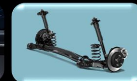
Suspensión Tras. de barra de torsión